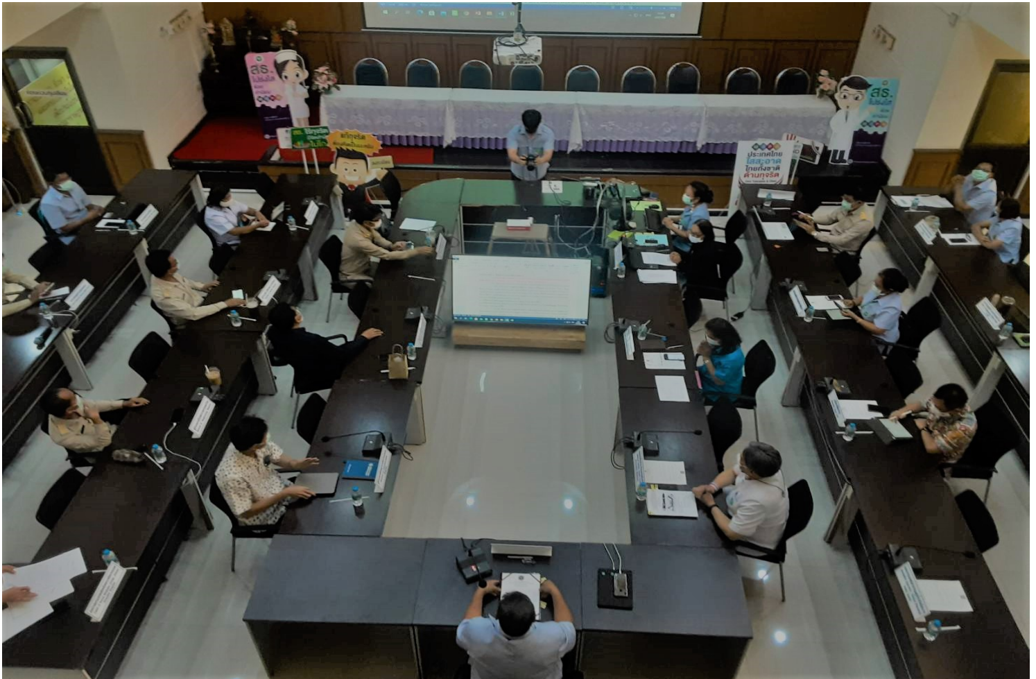
การลงนามประกาศเจตนารมณ์ต่อต้านการทุจริต “สำนักงานสาธารณสุขจังหวัดชัยนาทใสสะอาด ร่วมต้านทุจริต (MOPH Zero Tolerance)” ประจำปีงบประมาณ พ.ศ. ๒๕๖๔ ณ ห้องประชุมเจ้าพระยา ชั้น ๒ สำนักงานสาธารณสุขจังหวัดชัยนาท